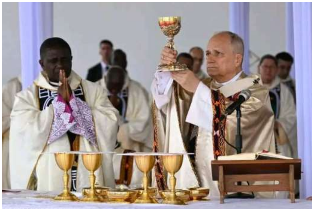
O Papa Leão XIV a presidir uma Eucaristia nos Camarões, em Abril de 2026

Aos 15 de Abril, o Papa Leão XIV, numa visita apostólica, proferiu o seu primeiro discurso no solo camaronês, no Palácio da Unidade, em Yaoundé. Lançou um forte apelo às autoridades, à sociedade civil e ao corpo diplomático, exortando-os a melhorar a governação, a prevenir a violência e a restaurar a esperança na juventude.