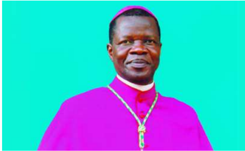
Dom Bernardin Francis Mfumbusa

A Igreja Católica em África lamenta a morte do Dom Bernardin Francis Mfumbusa, falecido aos 14 de Abril de 2026. Na sequência desta triste notícia, o Simpósio das Conferências Episcopais de África e Madagáscar (SCEAM) emitiu no mesmo dia uma mensagem de condolências. Membro do Comité Permanente do SCEAM, o Bispo Mfumbusa era uma figura proeminente na Comunicação Social Católica na África.