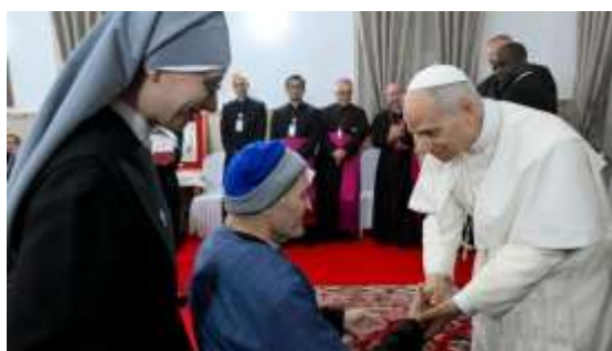
O Papa Leão XIV visita um lar de idosos em Annaba, Argélia, em Abril de 2026

Dirigindo-se às Autoridades e à Sociedade Civil, o Papa afirmou: «As Autoridades são chamadas não para dominar, mas para servir o povo e o seu desenvolvimento. O critério da ação política reside, portanto, na justiça, sem a qual não há paz autêntica, e expressa-se através da promoção de condições justas e dignas para todos.»