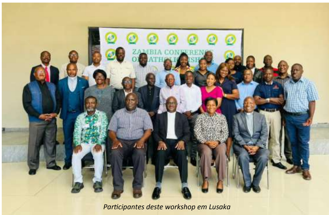
Participantes deste workshop em Lusaka

À medida que a Zâmbia se aproxima das eleições gerais prevista para Agosto de 2026, realizou-se em Lusaka, Zâmbia, dos 20 aos 21 de Abril de 2026, uma formação de alto nível para o reforço das capacidades, com o objetivo de promover um processo eleitoral transparente e democrático.