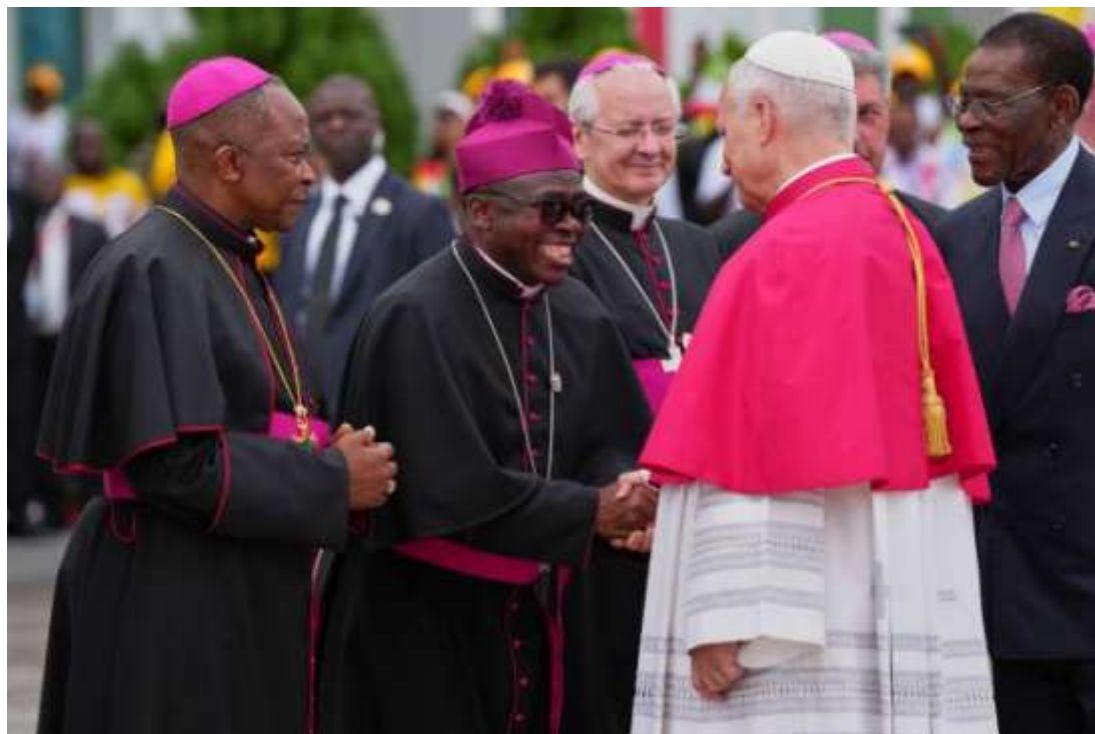
O Papa Leão XIV na Guiné Equatorial, Abril de 2026

Durante a sua visita à Guiné Equatorial, dos 21 aos 23 de Abril de 2026, o Papa Leão XIV denunciou a exclusão e apelou à esperança.