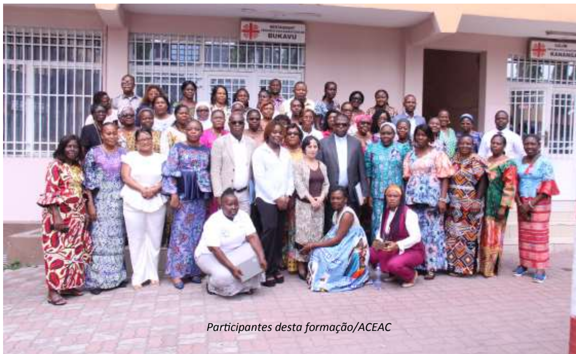
Participantes desta formação/ACEAC

Em Kinshasa, cerca de cinquenta mulheres líderes comunitárias receberam formação, dos 20 aos 25 de Abril de 2026, sobre os direitos humanos e o combate às práticas discriminatórias.