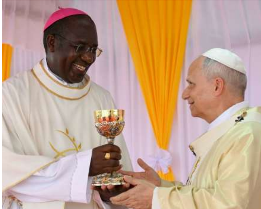
O arcebispo José Manuel Imbamba, de Saurimo, Angola, e segundo vice-presidente do SECAM, a entregar um novo cálice ao Papa Leão XIV, durante a sua visita a Angola, em Abril de 2026

O Papa Leão XIV visitou Angola dos 18 aos 21 de Abril de 2026. Esta visita apostólica inseriu-se num processo de diálogo, esperança e compromisso social.