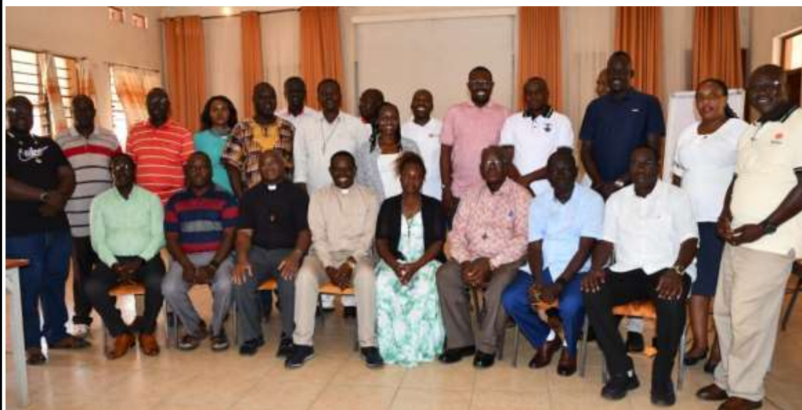
Participantes deste workshop/AMECEA

A Associação das Conferências Episcopais da África Oriental (AMECEA), em parceria com a Conferência Episcopal Católica do Sudão e do Sudão do Sul (SSSCBC), lançou um workshop de cinco dias sobre a edificação da paz e a defesa dos direitos no Sudão do Sul.