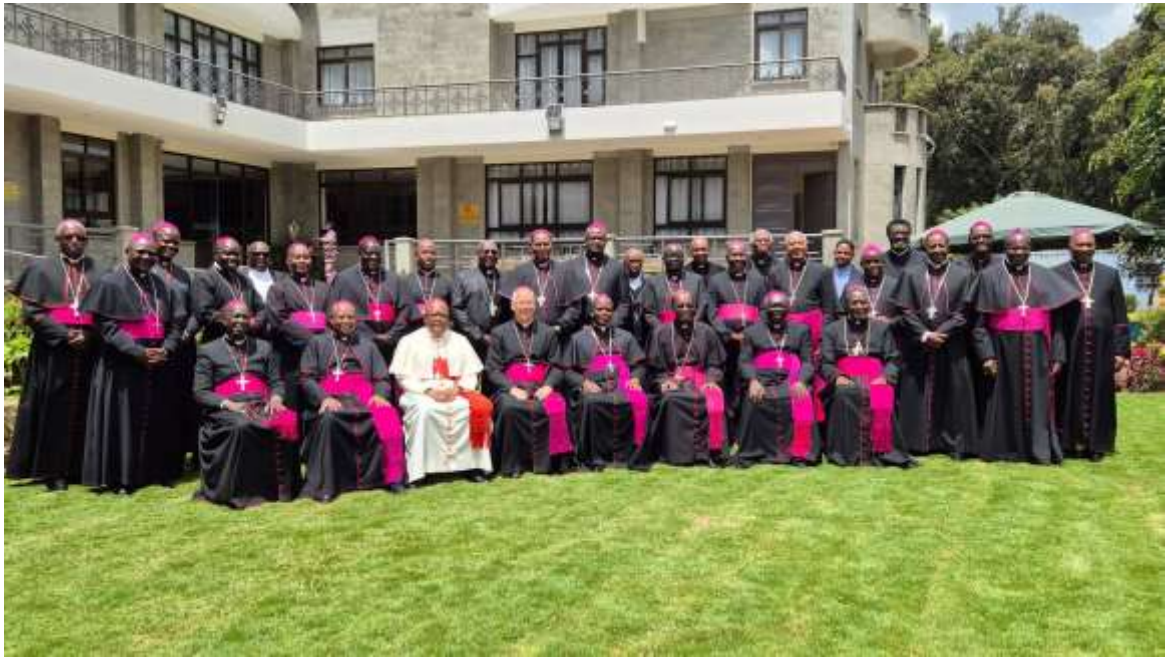
O cardeal Fridolin Ambongo, vestido de branco, entre os bispos quenianos

Nairóbi, 14 de Abril de 2026 – O presidente do Simpósio das Conferências Episcopais de África e Madagáscar, o Cardeal Fridolin Ambongo, felicita e encoraja os bispos católicos do Quênia nos seus esforços para intensificar a evangelização, a unidade e a sinodalidade.