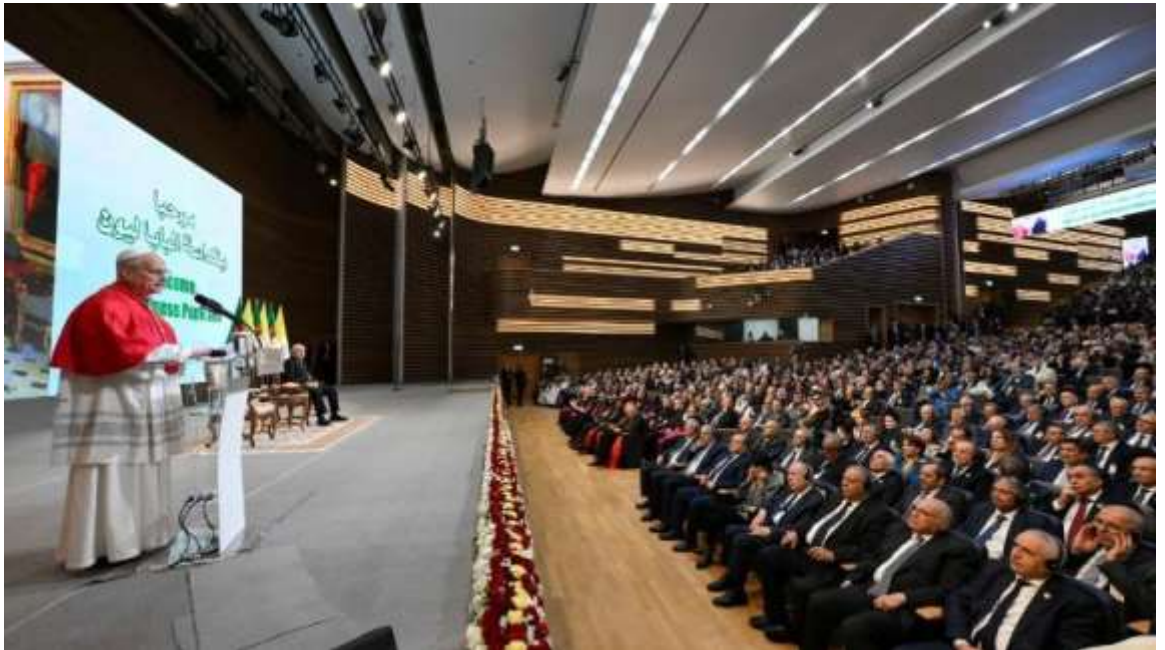
Le Pape Léon XIV lors de son discours aux autorités à Alger, Avril 2026

Première étape de la première visite de Léon XIV en Afrique : Algérie, du 13 au 15 avril 2026. Un pèlerinage lourd de sens sur les pas d'un Africain, saint Augustin, Docteur de l'Eglise, son père spirituel puisque ce pontife est membre de l'Ordre de Saint-Augustin. Lors de son séjour, il a appelé à l'unité, à la justice et à la paix.