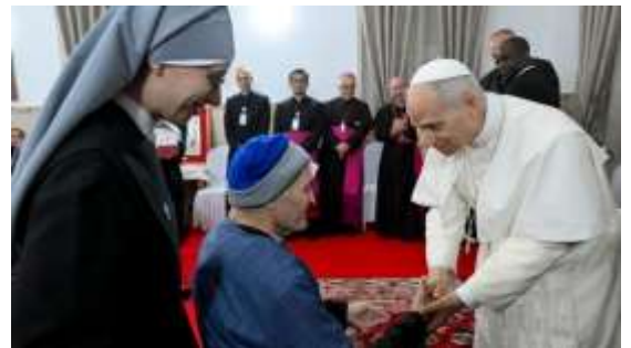
Le Pape Léon XIV lors de sa visite aux personnes âgées à Annaba, Algérie, Avril 2026

Le Pape a ensuite interpellé en ces termes : « Les autorités sont appelées non pas à dominer, mais à servir le peuple et son développement. Le critère de l'action politique réside donc dans la justice, sans laquelle il n'y a pas de paix authentique, et s'exprime par la promotion de conditions équitables et dignes pour tous ».