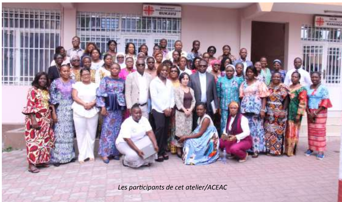
Les participants de cet atelier/ACEAC

À Kinshasa, une cinquantaine de femmes leaders communautaires ont été formées du 20 au 25 avril 2026 sur les droits de la personne et la lutte contre les pratiques discriminatoires.