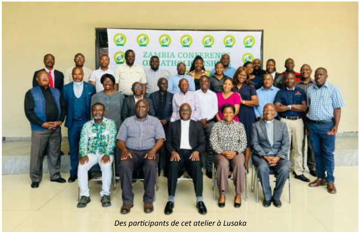
Des participants de cet atelier à Lusaka

À l'approche des élections générales en Zambie, prévues en août 2026, une formation de haut niveau de renforcement des capacités s'est tenue à Lusaka, en Zambie, les 20 et 21 avril 2026, afin de promouvoir un processus électoral transparent et démocratique.