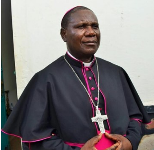
Mons. Désiré Lenge Mukwenye

O Santo Padre nomeou, no dia 17 de Janeiro de 2014, o Reverendo Désiré Lenge Mukwenye bispo de Kilwa-Kasenga, República Democrática do Congo. Dom Désiré Lenge Mukwenye serviu até agora como Administrador Diocesano da mesma Circunscrição Eclesiástica. Ele nasceu em 2 de Março de 1966 em Lwanza.