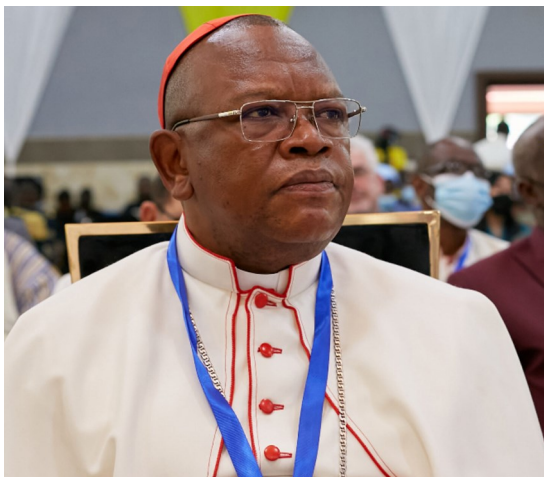
Cardeal Fridolin Ambongo