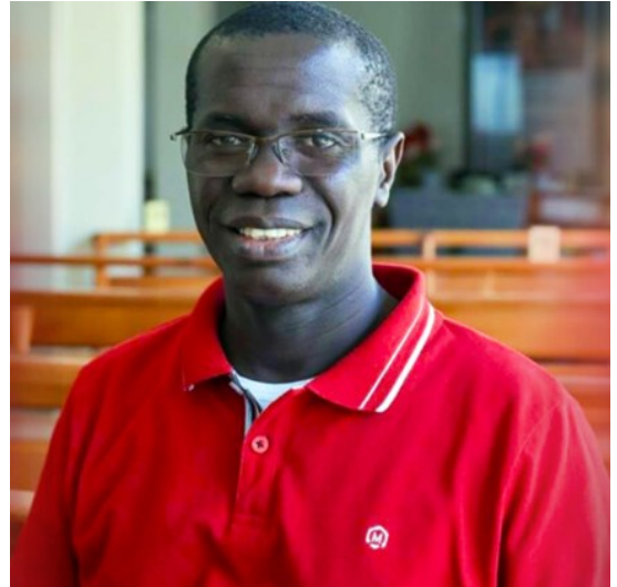
Mons. Victor Ndione

No dia 10 de Fevereiro, o Santo Padre nomeou o Reverendo Victor Ndione, até então Vigário Geral da Diocese de Nouakchott, Mauritânia, como bispo da referida Circunscrição Eclesiástica. Dom Victor Ndione nasceu em 1 de abril de 1973 em Thiès, Senegal..